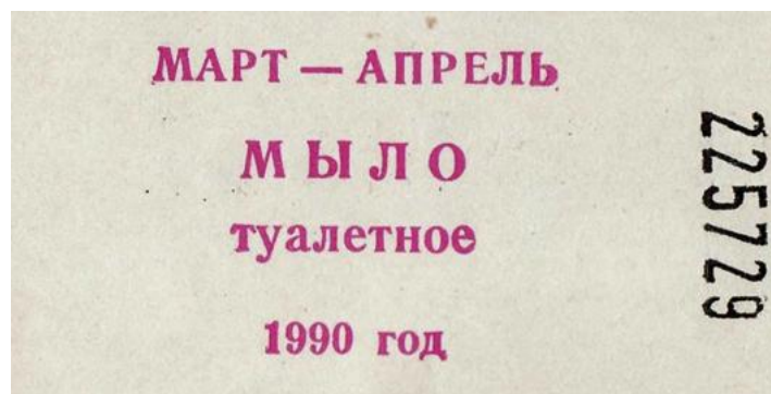
Талон на мыло. СССР. 1990.

Наверное сегодня тем, кто не знает/не помнит ситуацию конца 1980-х - начала 1990-х годов, трудно представить пустые полки в магазинах; талоны на сахар, масло, макароны, мыло и т.п. Что уж говорить про одежду и обувь для детей и взрослых. В больницах остро не хватало лекарств и современного медицинского оборудования. Да практически всё превратилось в трудно разрешимую проблему. В самой тяжелой ситуации оказались детские дома, интернаты, многодетные семьи.