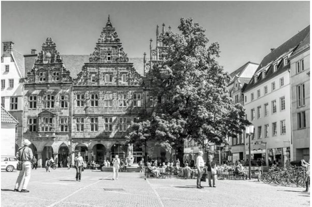
Город Мюнстер. Германия.

Наверное сегодня тем, кто не знает/не помнит ситуацию конца 1980-х - начала 1990-х годов, трудно представить пустые полки в магазинах; талоны на сахар, масло, макароны, мыло и т.п. Что уж говорить про одежду и обувь для детей и взрослых. В больницах остро не хватало лекарств и современного медицинского оборудования. Да практически всё превратилось в трудно разрешимую проблему. В самой тяжелой ситуации оказались детские дома, интернаты, многодетные семьи.