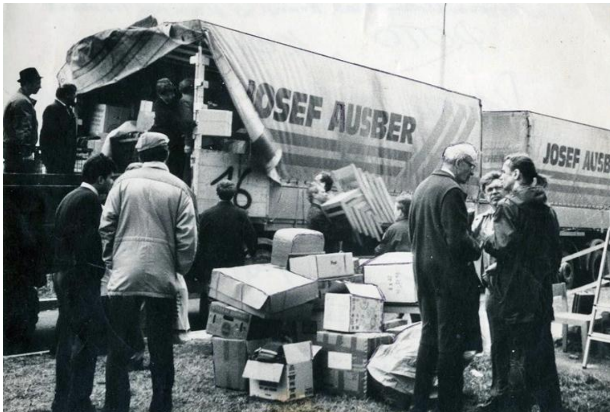
Мюнстерский гуманитарный конвой в Рязани.

Помощь из Мюнстера привозили гуманитарными конвоями, которые организовывал Немецкий Красный Крест и некоторые вестфальские фирмы.